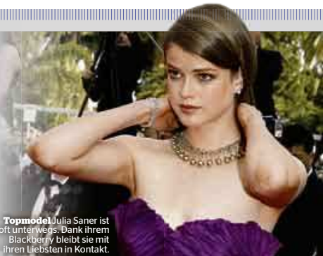
Topmodel Julia Saner ist oft unterwegs. Dank ihrem BlackBerry bleibt sie mit ihren Liebsten in Kontakt.

Das ist mein meistbenutztes Spiel auf meinem BlackBerry Traditionelles Jassen natürlich!