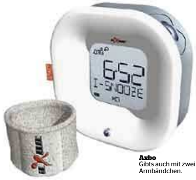
Axbo Gibts auch mit zwei Armbändchen.

Um eine hohe Qualität zu erreichen, kann StarMind nur nutzen, wer von einem bereits bestehenden Nutzer eingeladen wird. Mit etwas Glück kommen Sie heute aber auch ohne Einladung zu einem Account. Denn StarMind verlost 100 Zugänge. Einfach auf www.starmind.com/ blickamabend beim Wettbewerb mitmachen!